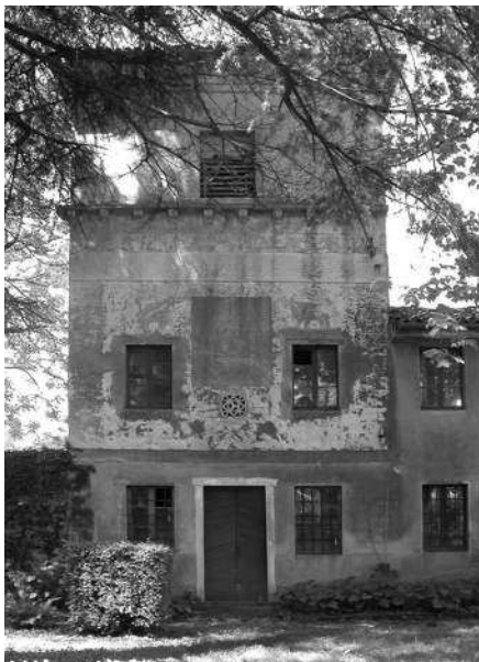
Lapide murata sulla facciata (N.L.)