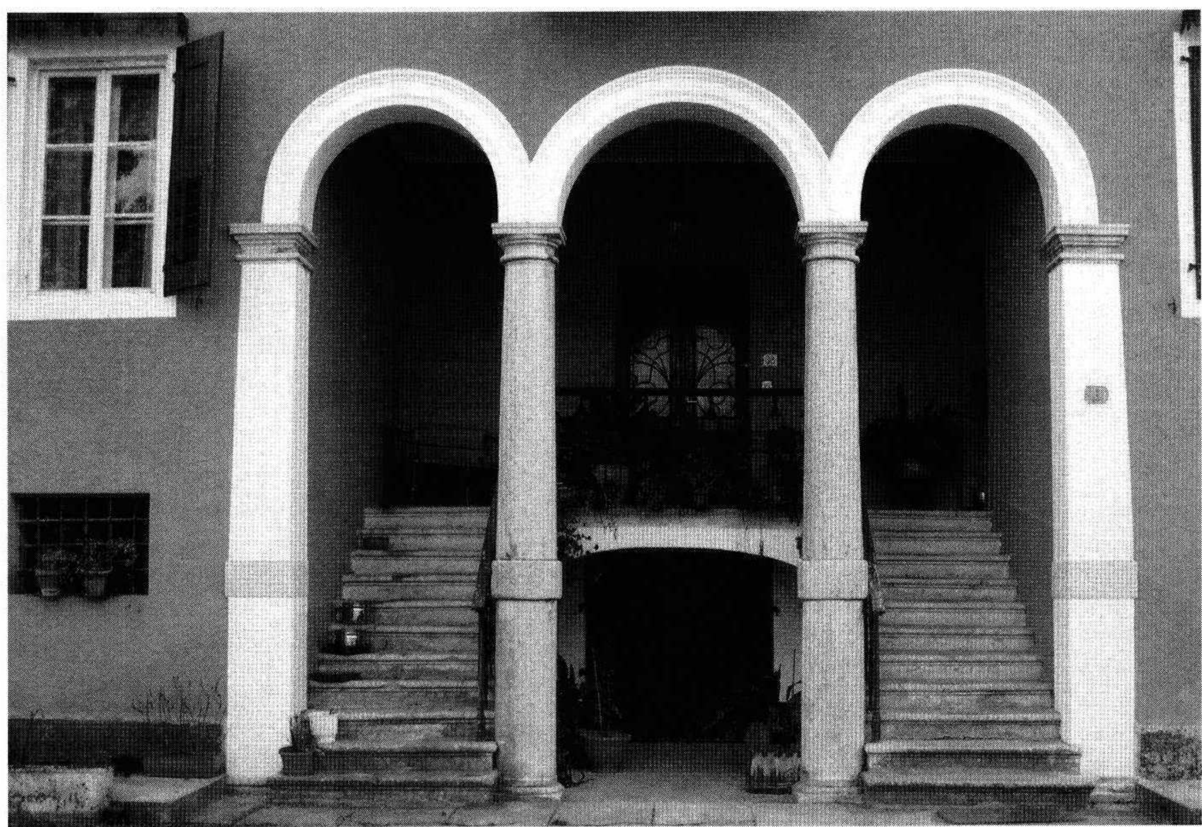
La loggia del fronte principale (S.B. 2005)

Attorno al corpo padronale, a pianta rettangolare, sorgono una serie di annessi realizzati probabilmente in periodi diversi. Attualmente la proprietà è stata frazionata e i rustici restaurati in modo indipendente, ma la morfologia originaria dell'insieme è ancora leggibile.