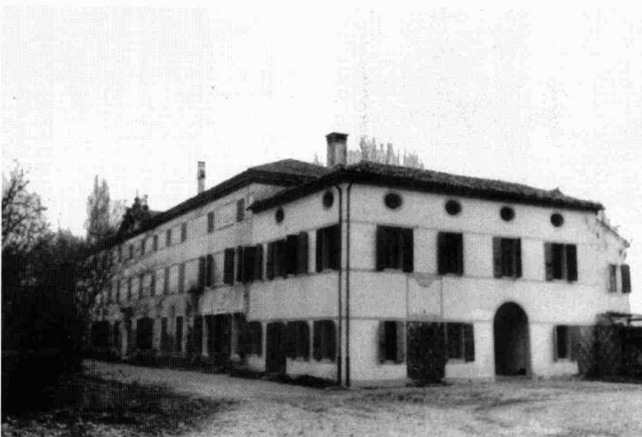
Villa e barchesse settecentesche in una stampa di fine Ottocento

All'interno l'edificio non conserva più alcun apparato decorativo, solo «un antico stemma di galera veneta in legno dipinto» nella sala maggiore (Mazzotti, 1954).