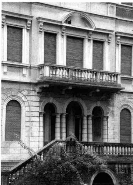
La villa vista dai mulini vicini Il partito centrale della facciata Particolare degli affreschi di facciata