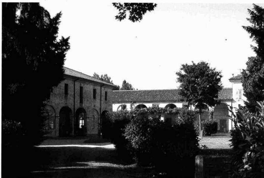
La facciata della chiesetta La corte con le barchesse