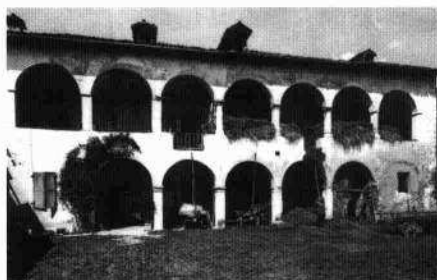
Il fronte prospiciente la corte prima del restauro (Archivio IRVV, 1972)

Lo stesso fronte dopo il restauro (S. Chiovaro, 1997)