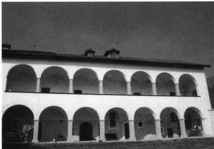
L'oratorio (S. Chiovaro, 1997)

Lo stesso fronte dopo il restauro (S. Chiovaro, 1997)