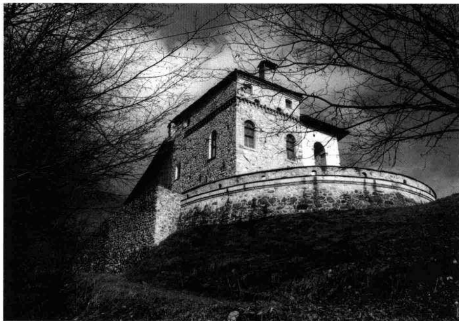
Veduta del complesso (M. De Santi, 1997) Il fronte nord-occidentale dell'edificio (L. De Bortoli, 2003)